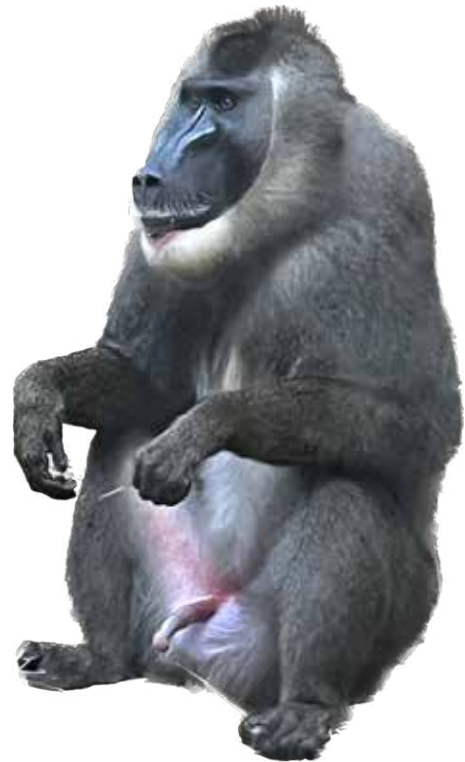
Männlicher Drill „Napongo“, ca. 10 Jahre

Marty, J. S.: Dominance, Coloration, and Social and Sexual Behavior in Male Drills ( Mandrillus leucophaeus ), International Journal of Primatology 30 (2009), S. 807–823.