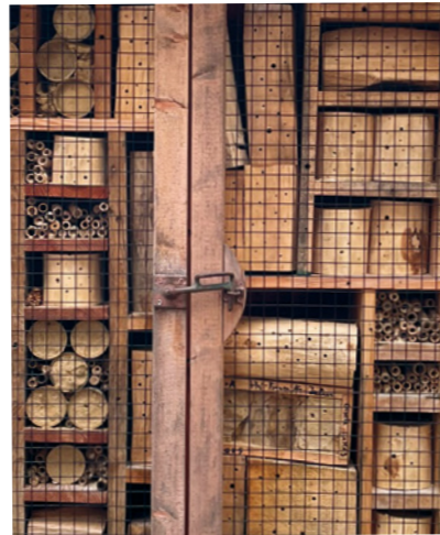
Ausschnitt Insektenhotel: Die „Einrichtung“ im Wildbienenhotel des Erlebnis-Zoo

Nicht also die erwachsene Wildbiene, sondern ihr Nachwuchs lebt im Hotel! Doch längst nicht alle Insektenhotels sind für Wildbienen geeignet. Der Erlebnis-Zoo zeigt mit seinem großen Wildbienen-Hotel, wie Bienenenschutz richtig gelingt. Es wurde von den Auszubildenden der Tierpflege eingerichtet!