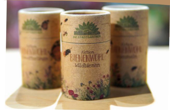
Wildbienenfutter: Saatgut-Mischung für eine blühende Pracht

Die Artenschutzwand im Zoo-Shop wird sich im Laufe des Jahres immer wieder verändern und den Fokus auf weitere, bedrohte Tierarten lenken. Es lohnt sich, regelmäßig vorbeizuschauen!