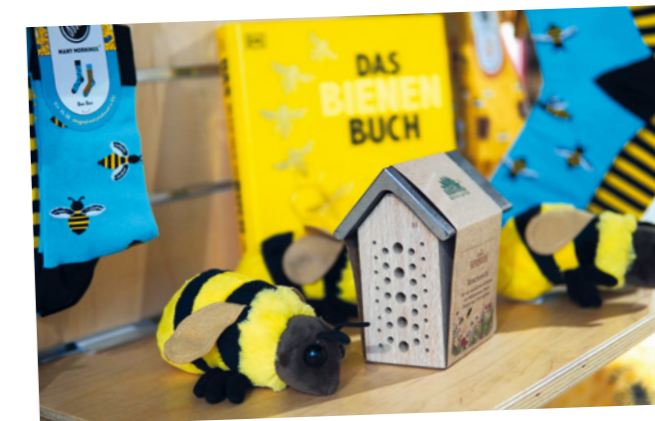
Herzlich willkommen: Insektenhotels für Wildbienen