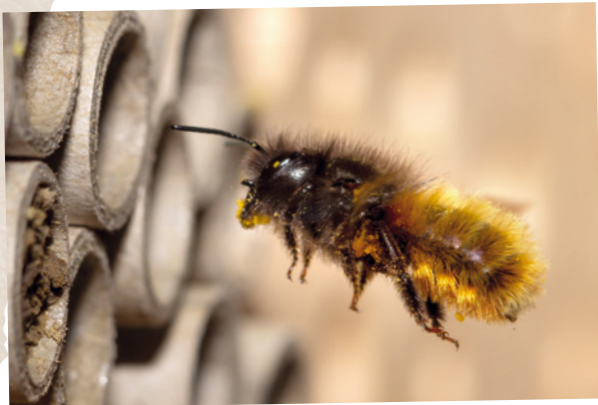
Hohlraum-Nister: Mauerbienen nutzen häufig Insektenhotels.

Mit den richtigen Insektenhotels können wir alle zum Schutz und zur Vermehrung der Wildbienen, die in Hohlräumen nisten, beitragen. Denn in den „Räumen“ der Hotels legen die Bienenweibchen ihre Eier ab, aus denen dann die Bienenlarven schlüpfen.