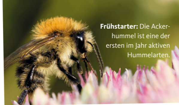
Frühstarter: Die Ackerhummel ist eine der ersten im Jahr aktiven Hummelarten.